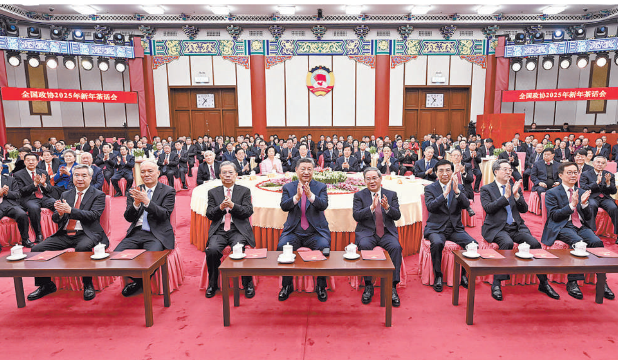
12月31日，全国政协在北京举行新年茶话会。党和国家领导人习近平、李强、赵乐际、王沪宁、蔡奇、丁薛祥、李希、韩正出席茶话会并观看演出。

新华社北京12月31日电 中国人民政治协商会议全国委员会12月31日上午在全国政协礼堂举行新年茶话会。党和国家领导人习近平、李强、赵乐际、王沪宁、蔡奇、丁薛祥、李希、韩正等同各民主党派中央、全国工商联负责人和无党派人士代表、中央和国家机关有关方面负责人以及首都各族各界人士