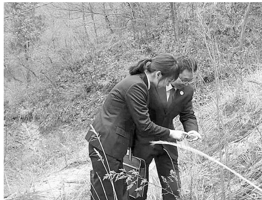
陕西省略阳县检察院检察官对尾矿库治理情况进行“回头看”。

凝聚各方力量实现行政与司法协同保护，共同促进秦岭生态环境持续向好。略阳县检察院依托与甘肃省康县、徽县等六地检察机关建立的嘉陵江上游(西汉水)流域综合治理跨区域检察协作机制，与四川省广元市朝天区、利州区、昭化区、甘肃省两当县、陕西省凤县等八地检察院建立的嘉陵江上游流域跨区域检察协作机制，为嘉