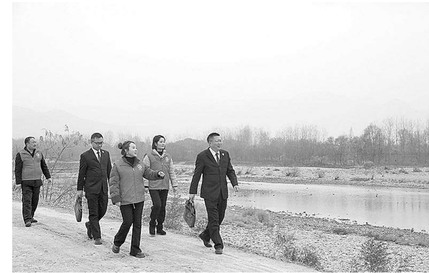
陕西省西乡县检察院干警邀请“益心为公”志愿者，在牧马河国家湿地公园开展整改效果“回头看”。

理部门职责权限，并达成整改及防治共识。随后，在检察机关的监督下，行政机关责令清理转运固体废物、加固河堤、播撒草种、栽植白杨等，使河道恢复