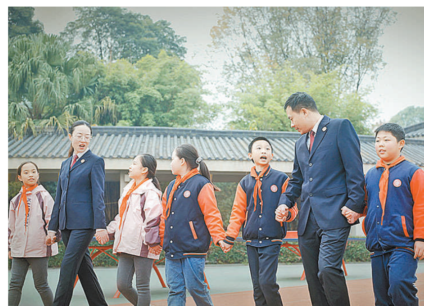
2024年10月，四川省成都市青羊区检察院开展“检校携手 共建平安校园”法治进校园活动。

今后，青羊区检察院将继续与得荣县检察院的援助情谊，全面夯实青羊检察业务发展根基，以高质量检察履职更好为大局服务、为人民司法、为法治担当。（徐梁）