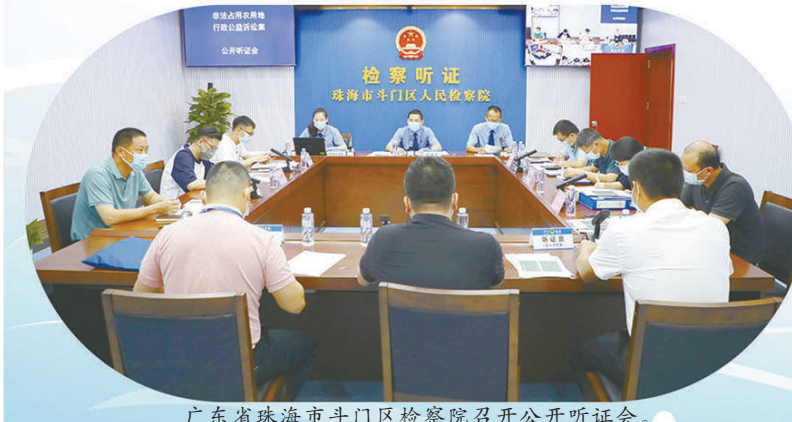
广东省珠海市斗门区检察院召开公开听证会。

日前,广东省检察机关保护中华白海豚的故事走进联合国《生物多样性公约》第十六次缔约方大会“中国角”,展示中华白海豚保护公益诉讼检察工作成效的主题宣传片亮相国际盛会,吸引世界各国参会代表驻足观看。