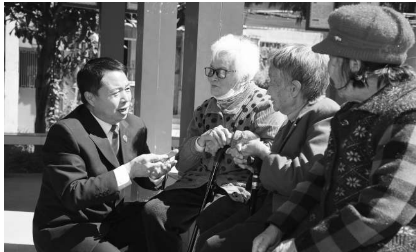
近日,云南省昆明市西山区检察院干警走进辖区区永昌街道开展普法宣传活动,为老年人讲解防范网络诈骗犯罪相关法律知识,帮助老年人增强法律意识。 本报通讯员洪伟摄

本报讯(记者肖俊林)记者近日从河北省检察院召开的新闻发布会上获悉,自“检护民生”专项行动开展以来,该省检察机关紧盯民生领域突出问题,依法全面履行法律监督职责,共办理各类“检护民生”案件3.1万余件。河北省检察院开展“燕赵山海·公益检察”之食品药品安全专项监督,聚焦8个重点方面40项具体问题,共立案2348件。强化网络安全、个人信息保护,严惩电信网络诈骗犯罪,提起公诉8739件11710人。加强生物识别、医疗健康、行踪轨迹等敏感个人信息保护公益诉讼检察工作,制发检察建议97件,起诉2件。