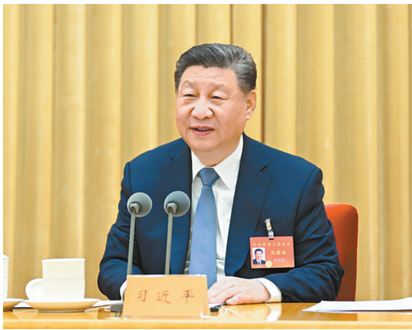
12月11日至12日，中央经济工作会议在北京举行。中共中央总书记、国家主席、中央军委主席习近平出席会议并发表重要讲话。