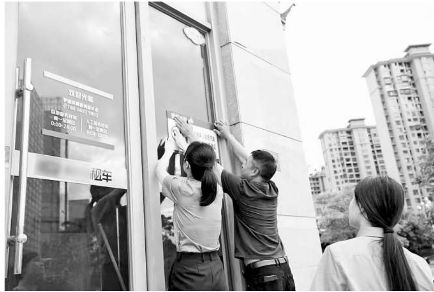
今年8月21日，福建省罗源县检察院未检部门检察官前往租车公司，督促该公司张贴禁止向未成年人租赁汽车提示牌。

不处罚，该院不断深化行刑反向衔接工作，逐案对不起诉案件进行审查，对符合行政处罚条件的依法提出处理意见。今年以来，该院依法对34名被不起诉人向行政机关提出行政处罚的检察意见。 “检察听证+行刑衔接”工作机制确保了不起诉案件办理的公正，有效杜绝“不刑不罚”，全面体现了法律刚性和司法温度，确保了“三个效果”有机统一。据悉，下一步，该院将继续贯彻落实“小案不小看，小案不小办”的办案理念，更大限度释放“检察听证+行刑衔接”工作机制的轻微刑事犯罪案件办理效能，让人民群众对公平正义可观可感可触。 （黄丹梅）