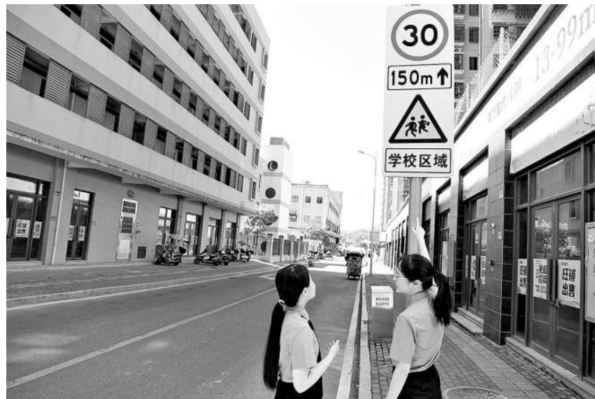
今年7月10日，福建省罗源县检察院未检部门检察官对校园周边道路交通安全情况开展调查。

确认定犯罪数额和损失范围。同时对犯罪嫌疑人的财产状况进行深入调查，做到底数清、情况明，为追赃挽损提供有力支撑。 推动认罪认罚，开启追赃挽损“快车道”。在向犯罪嫌疑人释法说理时，检察官充分讲解认罪认罚从宽制度，阐明主动退赃退赔的法律后果和从宽处理政策，促使犯罪嫌疑人积极配合追赃挽损工作，争取从轻处罚。 该院坚持“应追尽追，能追尽追”的原则，采取多元化措施督促犯罪嫌疑人退赃退赔，今年以来累计挽回各类经济损失800余万元。 （李位玲）