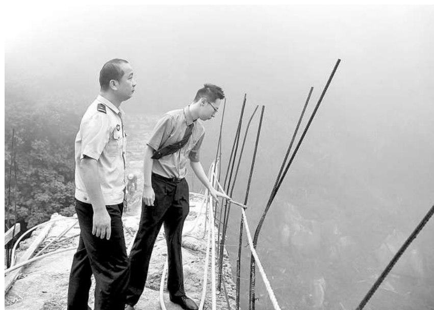
今年5月28日，福建省罗源县检察院检察官查看违建大坝拆除现场。

代理的人。租车公司为了赚租金，明知他们是未成年人，却选择“睁一只眼闭一只眼”。 针对案件中反映出的汽车租赁市场监管漏洞，罗源县检察院积极开展调查核实，与县交通运输局就发现的问题、查明的原因，进行磋商座谈、交换意见。2024年6月，该院向县交通运输局发出检察建议，督促其开展专项摸排整治、分级分类监督处置、加强法治宣传等，切实保障未成年人合法权益。 罗源县交通运输局收到检察建议后高度重视，立即成立工作专班，开展罗源县汽车租赁经营机构专项排查整治工作，截至目前，全县汽车租赁经营机构均整改到位。 （尤浅浅）