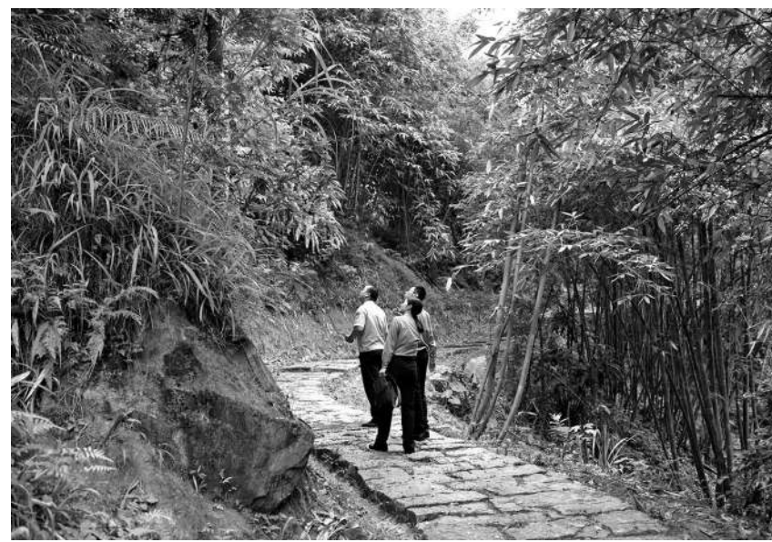
今年7月，福建省罗源县检察院检察官前往罗宁古道开展环境治理情况“回头看”。

全，对下游群众的生命财产安全造成重大威胁。针对该案违建时间长、整改难度大等问题，该院通过邀请村居志愿者参加圆桌会议、公开听证等办案方式，了解到解决问题的关键在于拆除资金无法落实。根据《办法》规定，该院向县政府申请召开专题会议，建议将已入库的45万元生态修复金先行用于违建水坝的拆除工作，确保在汛期来临前消除下游群众的“悬顶之患”。该案的办理得到县委县政府的批示肯定，取得良好的社会效果和法律效果。 下一步，该院将进一步发挥生态修复金账户优势，探索司法碳汇等多元生态修复新机制，绘就生态治理新蓝图，以高质量检察履职为护航美丽中国建设贡献检察力量。 （黄煜）