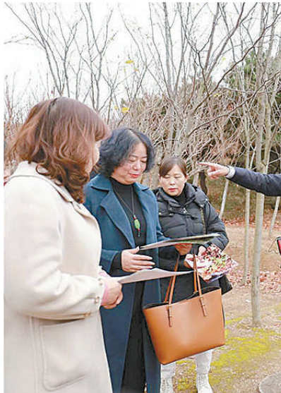
今年3月,在公益诉讼警示教育基地,陕西省汉中市汉台区检察院干警向汉中市人大代表介绍该院办理的一起公益诉讼案整改情况。

准理解把握最高检“一取消三不再”主旨要义,切实将检察管理从简单数据管理转向更加注重业务管理、案件管理、质量管理,以高水平、科学化的检察管理助推质效办案。坚持“放权”与“控权”并重,细化完善职权、职责清单,进一步加强对检察权力运行的监督制约。严格落实《案件质量评查办法》,把好案件出入口;强化流程监管,提升评查精准度,助推质效办好每一个案件。发挥“头雁”效应,检察长、副