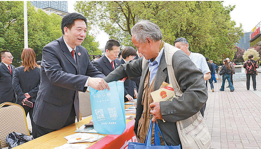
今年4月,陕西省汉中市汉台区检察院干警走上街头,向辖区居民宣传国家安全法等法律知识。

任务,有些改革任务的落实,同检察工作的开展密不可分,我院将主动找准为改革大局服务的切入点,助推在法治轨道上全面深化改革。聚焦推进经济体制改革,坚持和落实“两个毫不动摇”,依法平等保护各类市场主体;加强知识产权司法保护,依法从严惩治严重经济犯罪和金融犯罪,助力营造法治化营商环境。聚焦推进国家安全体系和能力现代化,依法严厉打击危害国家安全和群众反映强烈的违法犯罪。聚焦更好保障和改善民生,以“检察护企”“检察护民生”专项行动为抓手,坚持依法打击犯罪、支持起诉和化解矛盾纠纷并重,做实群众切实可感的检察为民。