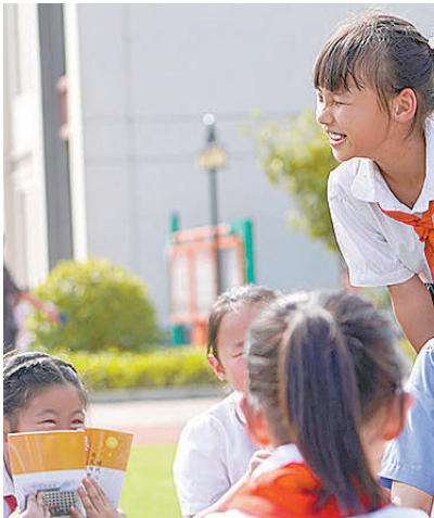
今年9月,陕西省汉中市汉台区检察院未检干警走进辖区学校,通过互动的形式为学生们讲解法律知识。

优化协作配合,加强洗钱犯罪治理。该院积极加强与监委、公安、法院、人民银行等反洗钱成员单位协作,构建案件会商、信息共享等协作机制,凝聚反洗钱工作合力,深化反洗钱法治宣传,合力推进洗钱犯罪治理。(章晓林)