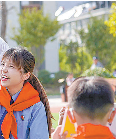
今年9月,陕西省汉中市汉台区检察院未检干警走进辖区学校,通过互动的形式为学生们讲解法律知识。

陕西省汉中市汉台区检察院不断优化办案模式、强化机制建设、延伸监督职能,多维度推进行刑反向衔接走深走实。2023年7月至今,该院共办理行刑反向衔接案件111件,实现从“接得住”到“接得好”的有效转变。 建章立制,加强内外协作。该院制定行刑反向衔接和行政违法行为监督工作实施办法,明确各内设部门的职责边界,形成分工明确、协同合作的工作模式。此外,该院会同公安、司法等部门制定行刑反向衔接工作机制实施办法,明确检察机关与行政部门相关案件衔接流