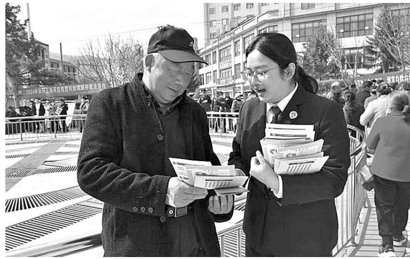
太白县检察院干警走上街头，向群众开展普法宣传。