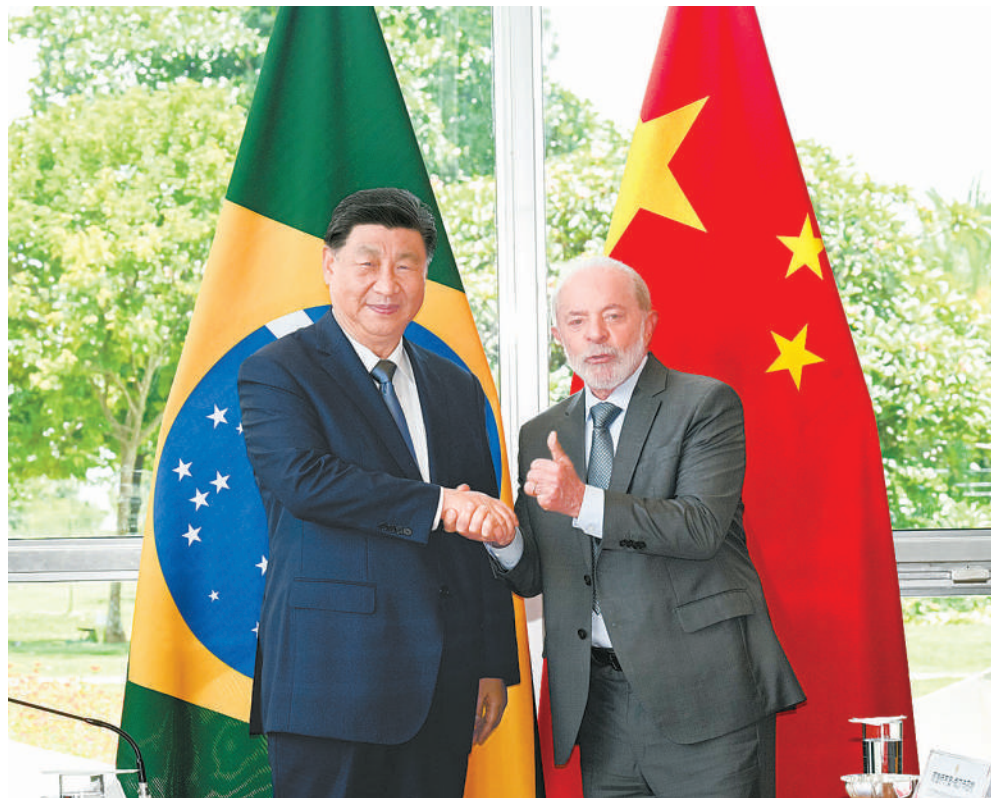
当地时间11月20日上午，国家主席习近平在巴西利亚总统官邸黎明宫同巴西总统卢拉举行会谈。

新华社巴西利亚11月20日电(记者倪四义 陈威华)当地时间11月20日上午，国家主席习近平在巴西利亚总统官邸黎明宫同巴西总统卢拉举行会谈。两国元首宣布，将中巴关系定位提升为携手构建更公正世界和更可持续星球的中巴命运共同体。