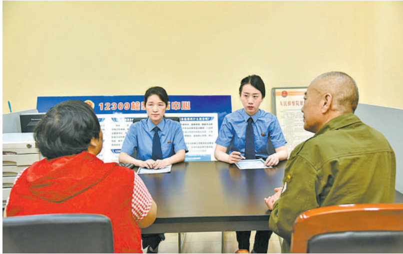
今年5月，蚌埠市检察院承办检察官调查核实老周的家庭情况，以确定其是否符合司法救助条件。

检察机关在调查核实案件基本事实后，根据行政诉讼证据标准，通过对在案证据全面综合分析判断，在此基础上提出抗诉，最终法院采纳检察机关的抗诉意见并改判，维护了特殊工种劳动者合法权益。