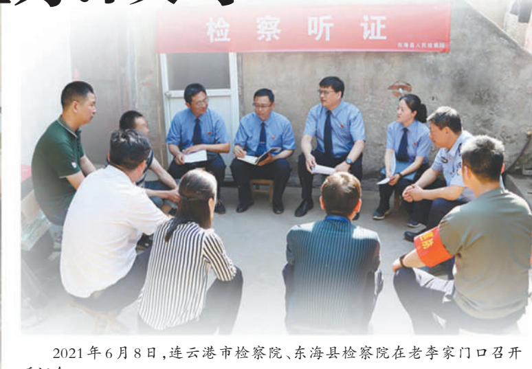
2021年6月8日,连云港市检察院、东海县检察院在老李家门口召开听证会。