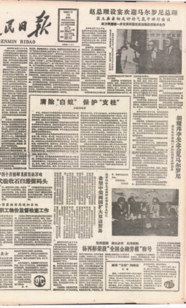
1986年5月10日的《人民日报》头版。