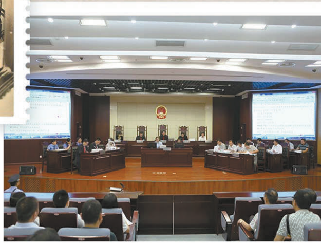
轰动全国的泰州“12·19”环境公益诉讼案法院一审开庭审理现场。

(江仁福 赵亮 李冰 马奥 沈桂林 张益铭 耿宜燕 蔡璐 沈晓棠 吴一凡对本文亦有贡献 视频制作:郭奥凝)