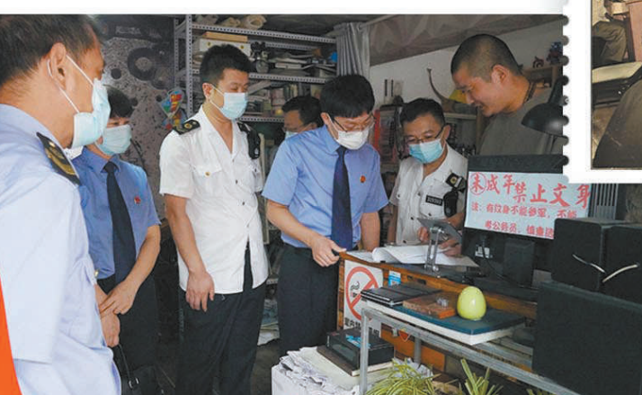
2021年9月8日,沐阳县检察院与当地卫健、市场监管部门对文身场所进行检查。