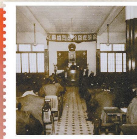
1953年6月,江苏省第一次检察工作会议召开。