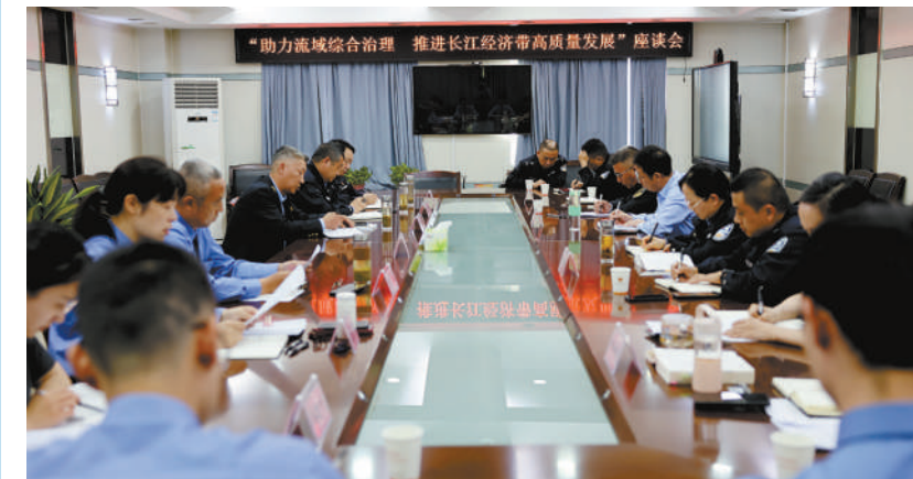
今年4月,樊城区检察院召集襄阳市农业综合执法支队、襄阳市公安局鱼梁洲开发区分局、襄阳市公安局樊城区分局三家单位召开助力流域综合治理座谈会。

此外,樊城区检察院还积极推动建立健全综合执法机制,压实河湖长监管责任等,全面加强汉江流域的非法捕捞治理工作,为守护汉江贡献检察力量。