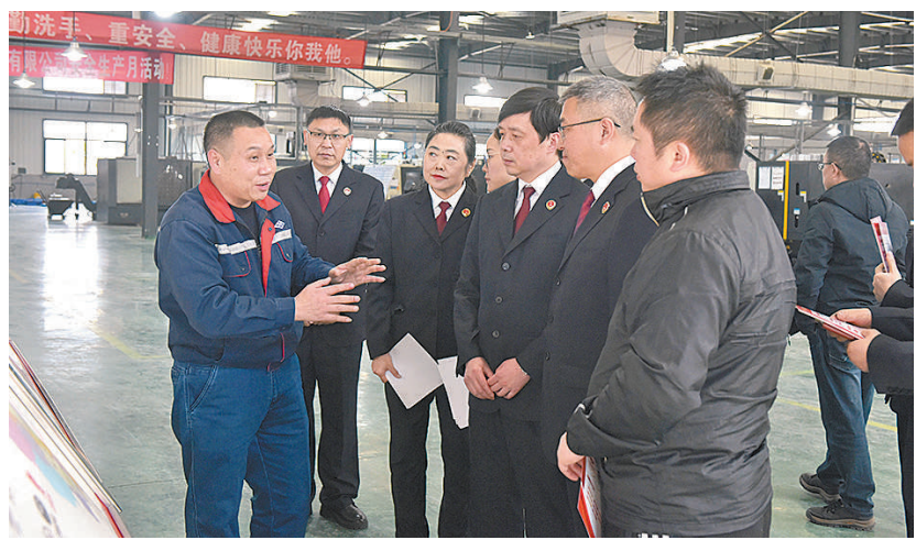
2024年1月,四川省邻水县检察院与重庆市渝北区检察院检察官共同走访川渝高新企业,了解企业生产经营情况及法治需求。