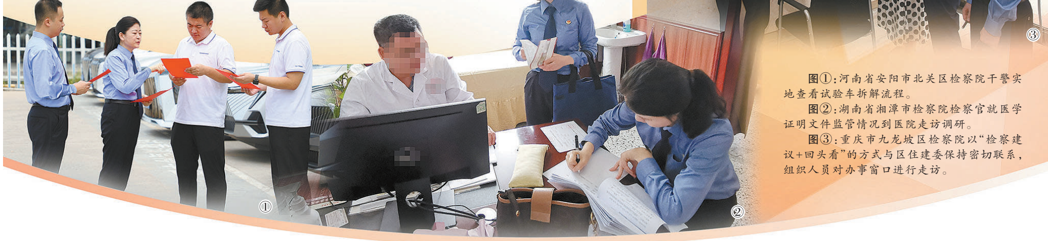
图①：河南省安阳市北关区检察院干警实地查看试验车拆解流程。

这些逻辑清晰、视野宏阔的要求，无疑对社会治理检察建议的制发提出了更高要求与标准。检察机关要深入学习贯彻习近平法治思想和党的二十大精神，把最高检党组对高质效办好每一个案件的部署要求抓实落细，牢牢立足司法办案基础，高质效制发每一份检察建议，紧盯“办复”，强化“治理”，努力在服务全面深化改革上、在维护国家安全、社会安定、人民安宁中扛实检察责任，做实为大局服务、为人民司法、为法治担当，在法治轨道上全面建设社会主义现代化国家展现更大作为。