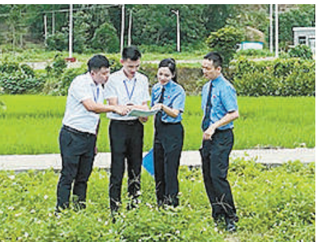
佛山市高明区检察院干警与生态环境部门工作人员查看生态修复情况。