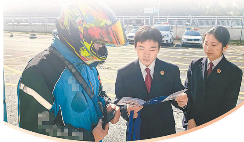
江苏省昆山市检察院检察官向外卖骑手开展公益诉讼法治宣传。

如何让一份社会治理检察建议达到高质效的标准？如何让人民群众切实感受到治理成效？近日，记者深入探寻这些优秀社会治理检察建议的制发过程与跟踪落实情况。