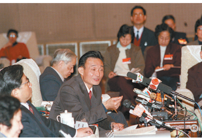
图⑤:1994年3月,时任上海市委书记的吴邦国同志在全国两会上海代表团全团会议上。