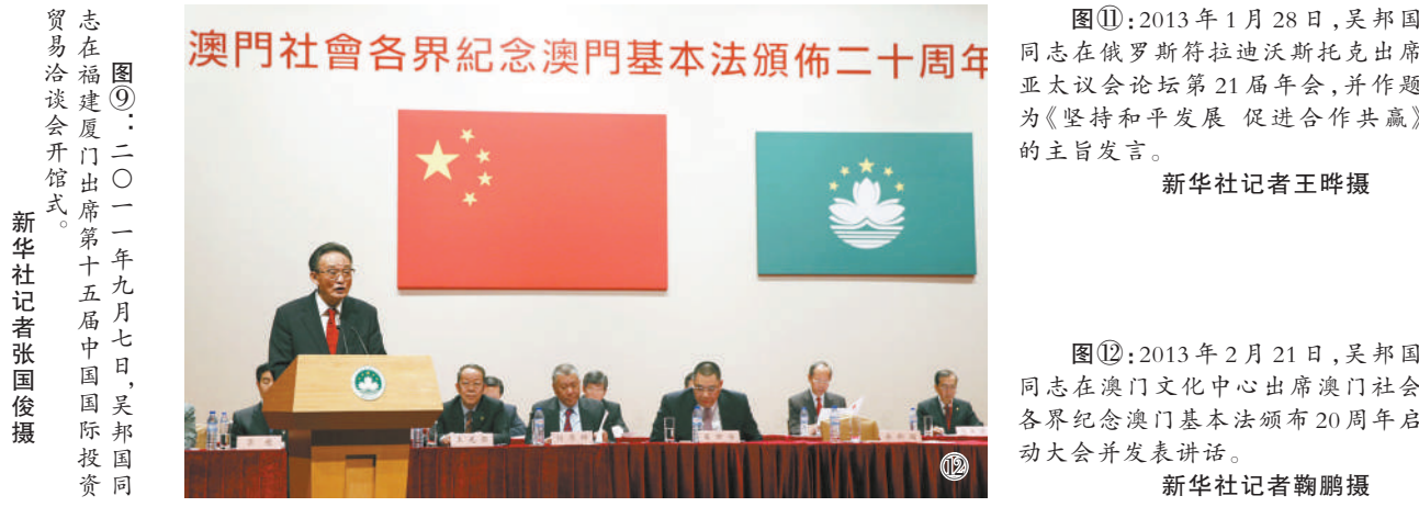
图⑪:2013年1月28日,吴邦国同志在俄罗斯符拉迪沃斯托克出席亚太经合组织论坛第21届年会,并作题为《坚持和平发展 促进合作共赢》的主旨发言。 图⑫:2013年2月21日,吴邦国同志在澳门文化中心出席澳门社会各界纪念澳门基本法颁布20周年启动大会并发表讲话。