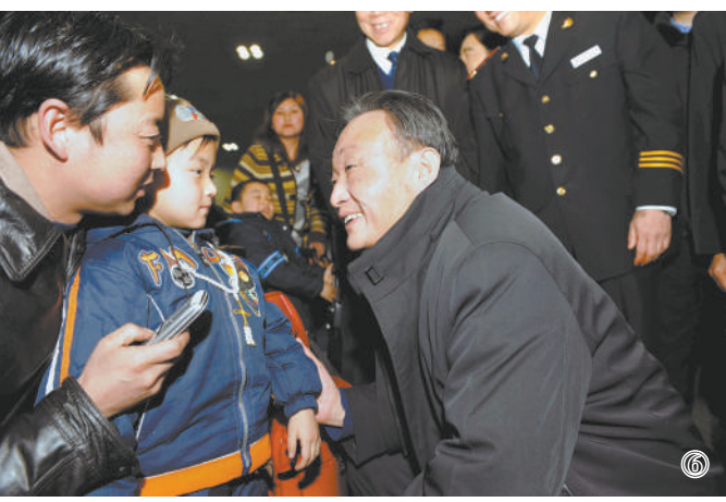
图⑥:2008年2月3日,吴邦国同志在北京西站候车室与旅客交谈。