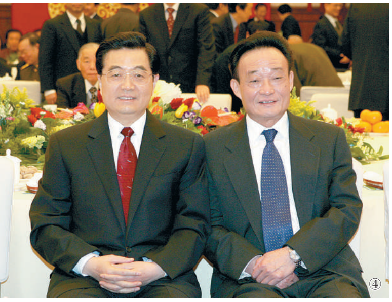
图④:二〇〇五年一月一日,全国政协在北京举行新年茶话会。这是胡锦涛同志与吴邦国同志在北京举行新年茶话会。