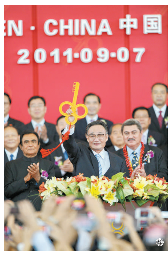
图⑨:二〇一一年九月七日,吴邦国同志在福建厦门出席第十五届中国国际投资贸易洽谈会开幕式。

吴邦国同志是中国特色社会主义民主法治建设的重要领导者。他强调,如果没有比较完备的、高质量的法律法规,就谈不上实现社会主义民主政治的制度化、规范化和程序化,就谈不上依法治国、建设社会主义法治国家。在党中央领导下,他将立法工作作为全国人大及其常委会的首要任务,紧紧围绕党中央确定的立法工作目标,坚持科学立法、民主立法,适应社会主义市场经济发展、社会全面进步和加入世贸组织的新形势,把中国特色社会主义法律体系中基本的、急需的、条件成熟的法律作为立法重点,抓紧制定修改相关法律,集中开展法律清理工作。2003年3月,他担任中央宪法修改小组组长,在中央政治局常委会领导下主持宪法修改工作。由十届全国人大二次会议通过的宪法修正案,确立了“三个代表”重要思想在国家政治和社会生活中的指导地位,明确国家尊重和保障人权、依法保护公民的私有财产权和继承权等内容,对促进我国经济社会发展、推进中国特色社会主义民主法治建设具有重要意义。在他的主持下,第十届、十一届全国人大及其常委会共审议通过宪法修正案草案、法律草案、法律解释草案和有关法律问题的决定草案186件,包括物权法、企业破产法、企业所得税法、公务员法、行政许可法、治安管理处罚法、劳动合同法、未成年人保护法、妇女权益保障法、关于加强网络信息保护的決定等。在党中央领导下,他主持制定反分裂国家法,把党和国家对台工作的大政方针和政策措施以法律形式固定下来,为反对和遏制“台独”分裂活动、促进祖国和平统一提供有力法律保障。他主持对香港特别行政区基本法、澳门特别行政区基本法及其附件有关条款作出解释并通过相关决定,推动两个基本法正确实施和“一国两制”方针贯彻落实。他主持制定修改一系列对中国特色社会主义事业发展具有重大影响的法律,为推动形成中国特色社会主义法律体系作出重要贡献。(下转第六版)