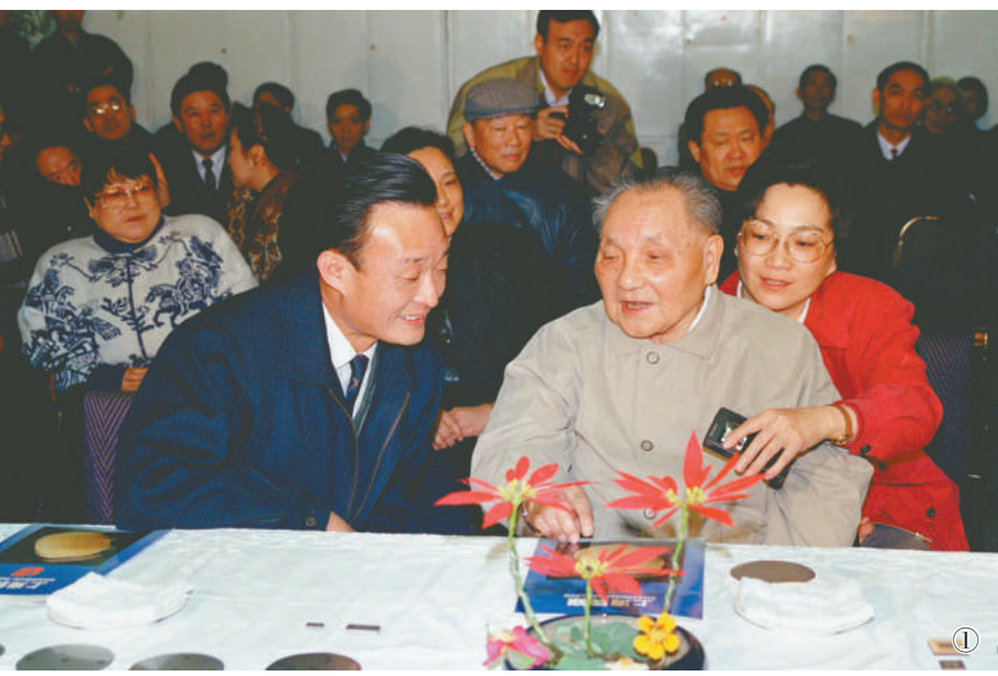
图①:1992年2月10日,邓小平同志在上海贝岭微电子制造有限公司参观时与吴邦国同志交谈。