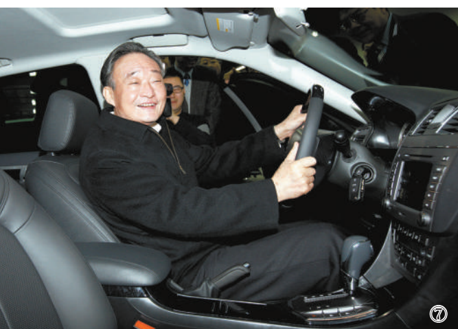
图⑦:2010年1月30日,吴邦国同志在上海汽车集团股份有限公司技术中心察看新能源车。