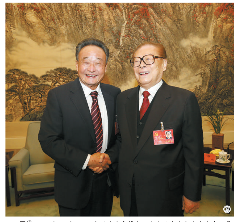
图③③:2012年11月14日,中国共产党第十八次全国代表大会在北京闭幕。这是闭幕会前,江泽民同志与吴邦国同志在一起。