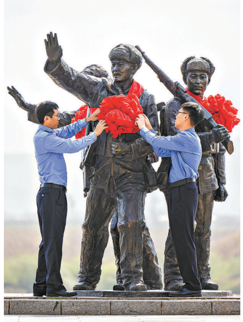
鸭绿江浮桥遗址位于辽宁省丹东市振安区，是抗美援朝时期中国人民志愿军赴朝参战的主要通道之一。在第11个烈士纪念日到来之际，振安区检察院检察官来到鸭绿江浮桥遗址，为抗美援朝主题纪念雕塑系上“红飘带”，并向周边群众宣传英雄烈士保护法等法律法规，增强公众崇尚英烈、保护英烈的意识。