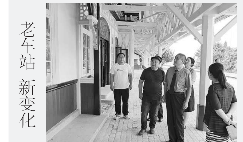
老车站新变化 近日,具有百年历史的旅顺火车站修缮完毕,成为辽宁省大连市的又一网红打卡地。旅顺火车站始建于1898年,是我国第一列国际列车的始发站,也是我国目前保存最完整的具有典型俄罗斯风格的木造平房建筑之一。由于年久失修,车站出现了墙面喷漆脱落、部分木质结构开裂蛀空、屋内墙体破裂发霉等严重情况。今年年初,大连铁路运输检察院经过调查取证,在确认责任主体后,通过磋商程序督促行政机关履职,在该院与行政机关的共同努力下,修缮工作于今年8月结束。图为近日检察官来到旅顺火车站回访。

本报北京9月13日电(记者刘亭亭) 记者今天从最高人民检察院获悉,贵州省高级法院原正厅长级干部唐林涉嫌贪污、受贿一案,由贵州省监察委员会调查终结,移送检察机关审查起诉。经贵州省检察院指定管辖,由铜仁市检察院审查起诉。日前,铜仁市检察院依法以涉嫌贪污罪、受贿罪对唐林作出逮捕决定。该案正在进一步办理中。