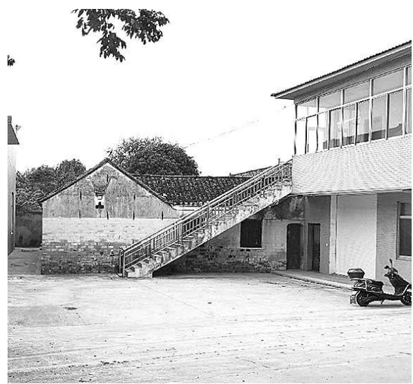
整改前文物保护范围内存在违章建筑(右侧房屋)。