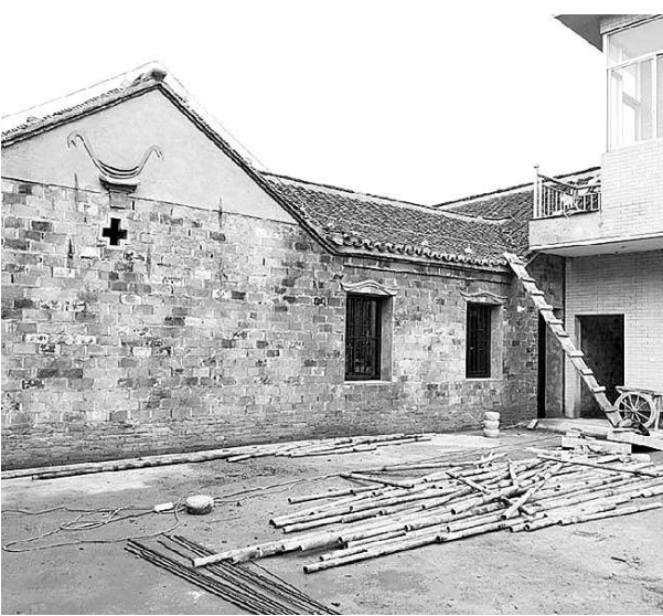
经监督后仅拆除部分违章建筑附属设施。