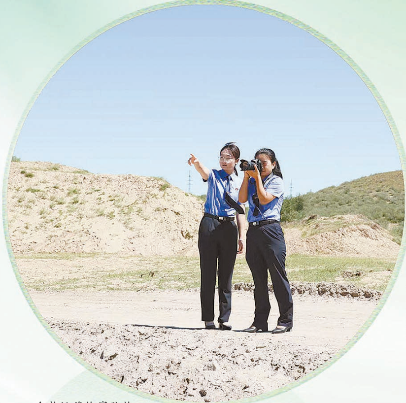
▲敖汉旗检察院检察官实地踏查沙地生态保护情况。

敖汉旗检察院还协调相关单位在康家营子村打造新征程展馆，使之成为宣传治沙工作的教育实践平台，引导社会公众树立生态文明理