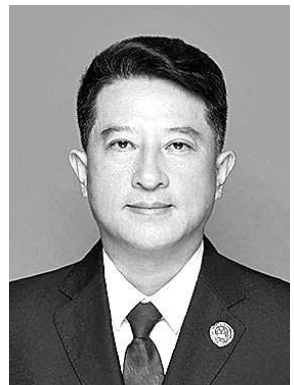
建立中国(河南)自由贸易试验区是党中央、国务院作出的重大决策，也是新形势下全面深化改革、扩大对外开放的重大举措。党的二十届三中全会为服务保障更高水平自贸区建设指明了方向，我院深刻领会全会精神，准确把握核心要义，以全会精神为指引，以高质量检察管理为抓手，为更高水

平自贸区建设保驾护航。革新理念，把稳服务自贸区建设的思想之舵。我院树立胸怀大局理念，自觉把检察工作放到自贸区建设的大局中去思考谋划、主动作为。2023年以来，我院相继出台发挥检察职能服务保障自贸区建设的16条意见、服务保障郑东新区“三高地、两中心、一新城”建设的10条意见和服务保障经开区经济社会发展计划的意见，努力为更高水平自贸区建设提供法治保障。同时，我院树立多赢共赢理念，深刻认识检察工作高质量发展与更高水平自贸区建设互促共进的良性互动关系，依法担当作为；树立开放创新理念，深入开展“检察护企”专项行动，依法严惩犯罪者、支持改革者、保护创新者，为自贸区建设营造良好的法治化营商环境。