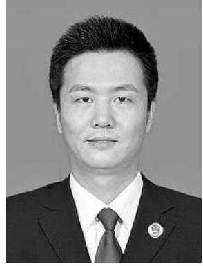
党的二十届三中全会提出：发展全过程人民民主是中国式现代化的本质要求。深入践行全过程人民民主，是检察机关深化改革、推动发展的重要举措。近年来，我院自觉把握检察监督与人大监督、政协民主监督的内涵，积极与人大、政协对接，构建队伍互动共育、建议议案双向转化、载体融合创新

等三项机制，将检察监督、人大监督、政协民主监督融会贯通，凝聚维护国家和社会公共利益的合力。建立队伍互动共育机制。我院利用市委常委会专门听取检察建议工作的契机，积极与人大、政协对接，院党组主动汇报工作，争取人大、政协支持；安排专项联系人定期与人大、政协沟通检察工作情况，将全市政协委员聘任为检察公益诉讼观察员；依托政协“大讲堂”、委员培训等平台宣讲检察工作，增进人大代表、政协委员对“四大检察”的了解。