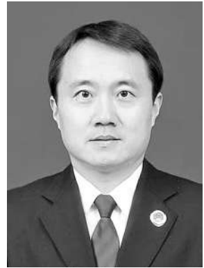
新时代新征程推进检察工作现代化，根本靠党建，关键靠队伍。近年来，我院深入学习贯彻习近平法治思想，创新打造“1+3+5”党建工作体系，以“党建红”引领“检察蓝”，守护“生态绿”，为打造黄河流域生态保护和高质量发展示范区提供坚强有力的司法保障。

保障。打造一个品牌，夯实“原动力”。我院从满足人民群众更高层次的司法需求出发，以品牌建设为引擎，推动思想与实践同频共振。在打造党总支“黄河口正义先锋”头雁品牌及三个支部“正心护民”“益心为公”“倾心助民”雁阵齐飞品牌集群，全面推进党建与业务一体化联动融合的基础上，我院扎实推进“事心双解和为贵”试点工作；深化落实“河湖长+检察长”协作机制；选派4名党员骨干组建涉企案件专业化办理团队，助力营造法治化营商环境；开展打击养老诈骗犯罪专项行动，依法守护“养老钱”，办理的一起案件入选最高检发布的维护弱势群体合法权益民事执行检察典型案例。