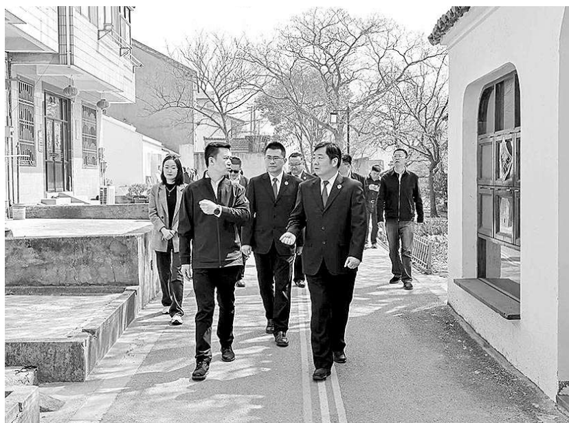
2024年4月1日，苏州市检察院党组书记、检察长李军带队调研乡村振兴工作。

“检察护民生没有终点，只有连续不断的新起点。苏州市检察机关将通过最高质效办好每一个案件，把惠民生、暖民心、顺民意的检察工作做到群众心坎上，以更多真抓实干提升获得感、幸福感、安全感更加充实、更有保障、更可持续。”苏州市检察院党组书记、检察长李军表示。