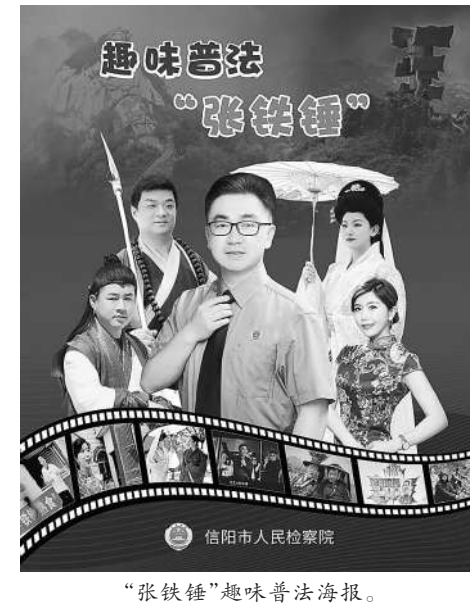
“张铁锤”趣味普法海报。

“检察圈”,进入老百姓的“朋友圈”。“张铁锤”是将普法做在日常,以智慧和才华奏响法治深入人心交响乐的尽职尽责者。