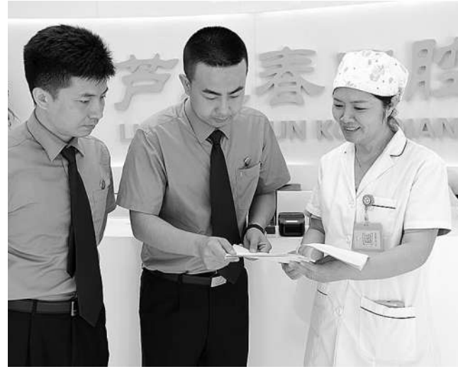
检察官回访查看整改成效。