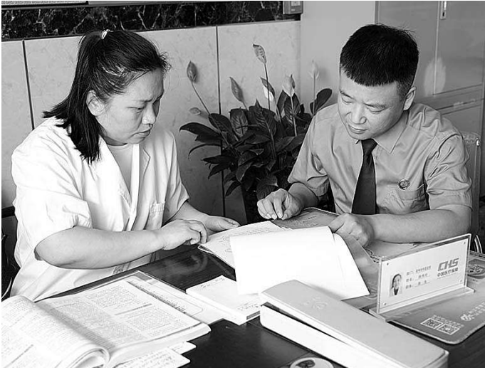
检察官查阅涉医疗废物登记表、台账等资料。

走访中,检察官仔细查看医疗机构执业许可证、从业人员资质,查阅涉医疗废物登记表、台账等,现场了解落实医疗废物管理制度和医疗废物分类、贮存、转运、登记等情况。