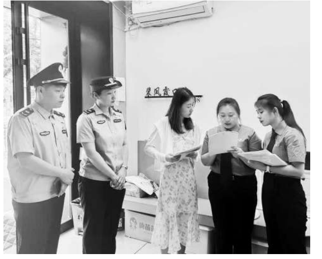
检察机关依法向卫健部门制发检察建议。