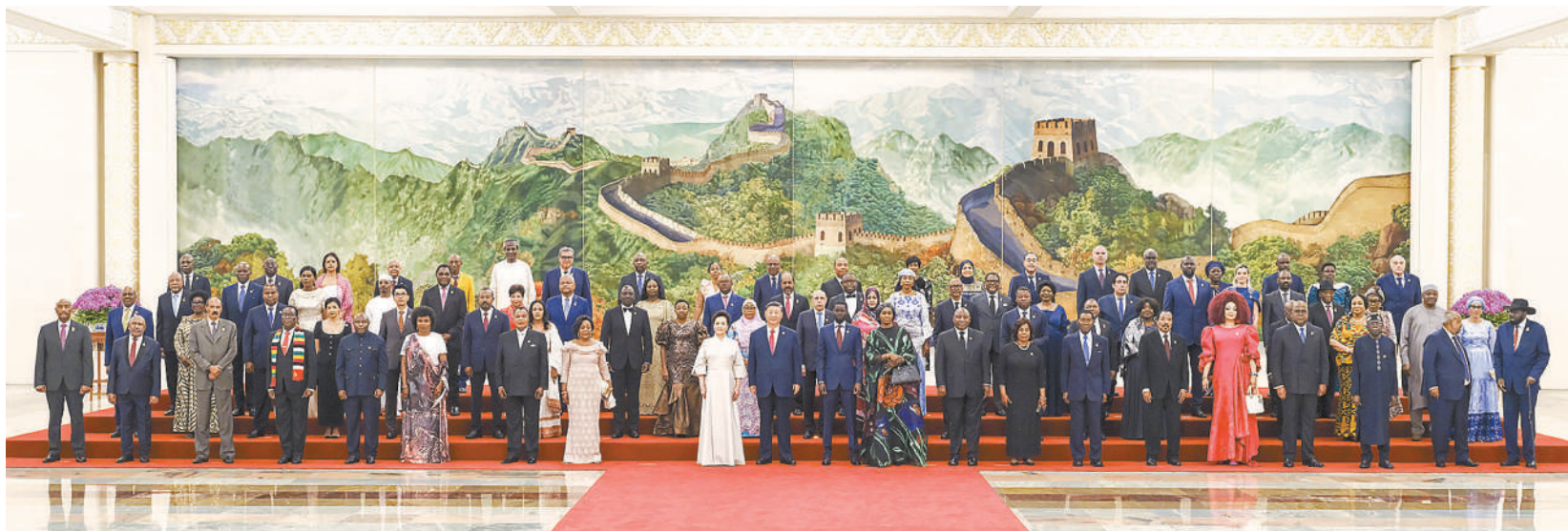
▲9月4日晚，国家主席习近平和夫人彭丽媛在北京人民大会堂举行宴会，欢迎来华出席中非合作论坛北京峰会的非方及国际贵宾。这是宴会前，习近平和彭丽媛同贵宾们集体合影留念。