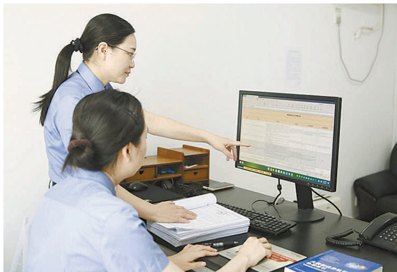
办案过程中,检察官研发大数据法律监督模型。

H区汇聚着千余家工程设计与建造企业,在建工程体量近900万平方米。面对“三包一挂”违法违规行