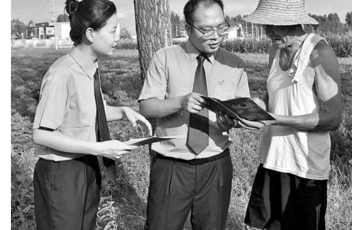
检察干警到田间地头开展耕地保护法治宣传。