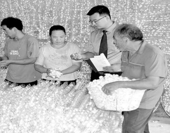
检察干警向蚕农了解桑田复耕后的收获情况。