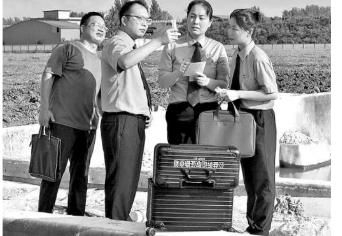
检察干警到现场检测水质。

2023年初,有群众向河南省社旗县检察院反映,某冶炼企业使用酸性溶液提炼硅石和石英砂并违规排放酸性废水,导致附近百亩桑田土壤发生改变,不仅桑叶质地变差,且大幅减产。 办案中,检察官邀请当地生态环境部门专家参与调查取证,评估土地生态受损程度等,为检察机关提起公诉提供专业技术支持。 与此同时,该院积极践行恢复性司法理念,督促制定生态修复方案,受损土地得以修复。