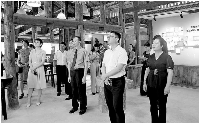
代表委员深入了解重庆市检察机关“检察护企”专项行动成效。

此前，酉阳县检察院在开展“检察护企”专项行动中收到线索，该公司新建的生产线基建及装修工程厂房之间未做防火分区隔断，消防通道不够畅通，不能满足消防要求。该院对此进行公益诉讼立案。考虑到该公司经营现状和实际困难，检察机关联系相关职能部门进行磋商，围绕整改方案进行多方讨论，建议改造、完善消防设施设备，最终