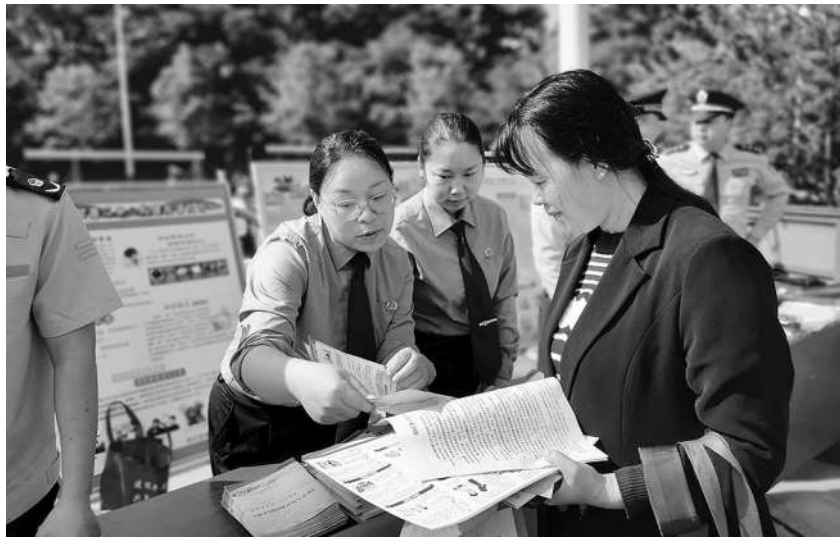
近日，陕西省西乡县检察院开展民法典普法宣传进社区活动，检察官警现场向群众发放民法典宣传手册，并解答群众的法律咨询。

发“汉中仙毫”地理标志产品的司法保护。该院与县科学技术局在全国百强茶企业设立知识产权联系点，宣