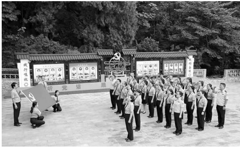
近日，陕西省西乡县检察院组织干警到徐家坪红色教育基地开展主题党日活动，通过参观红色教育基地、重温入党誓词，激励全体干警牢记嘱托，激励奋进。

保护知识产权，服务企业高质量发展。强化“汉中仙毫”地理标志产品的司法保护。该院与县科学技术局在全国百强茶企业设立知识产权联系点，宣