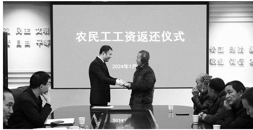
陕西省白河县检察院办理了一起支持农民工起诉讨薪案件，因为工资返还仪式现场。