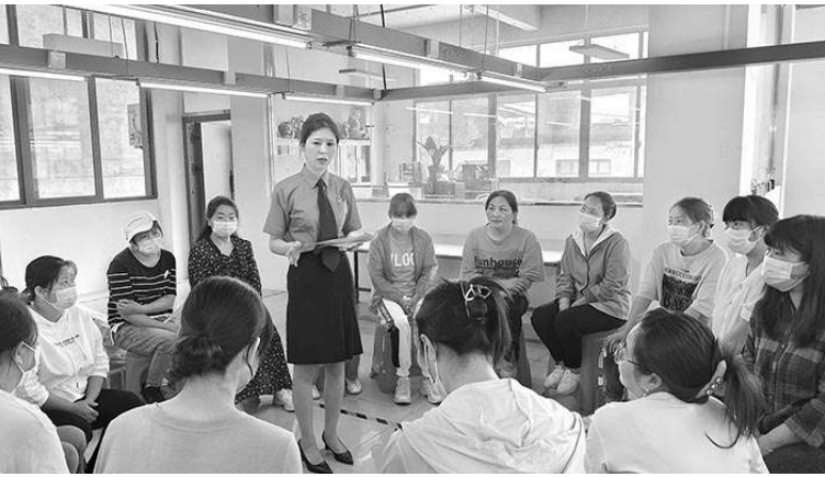
陕西省白河县检察院开展“送法进企业”活动，检察干警通过典型案例讲解为企业员工送上“法治大礼包”。

四是以数字赋能为方向。党的二十大报告要求完善网格化管理、精细化服务、信息化支撑的基层治理平台。因此，要加强数字赋能，在打造多网合一的基层治理平台上下功夫，通过集成化的信息平台，实现社情民意收集、矛盾纠纷处理、办理结果反馈的闭环管理，不断提升基层社会治理效能。 (刘宝利)