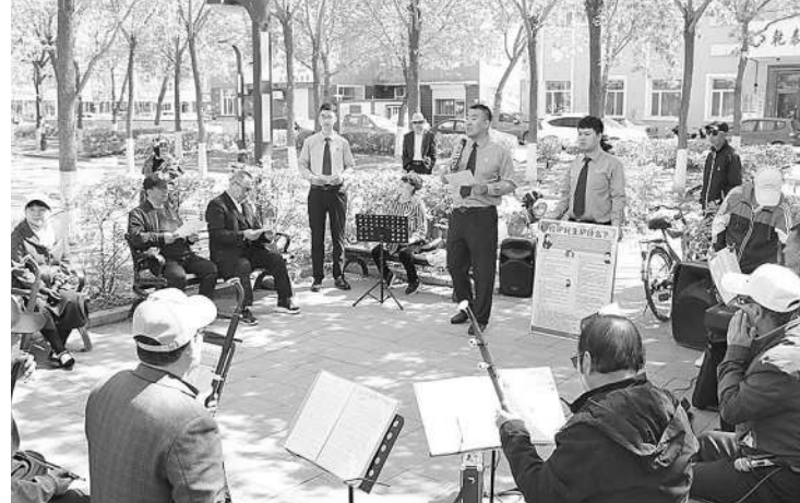
检察干警进社区讲解如何防范养老诈骗。