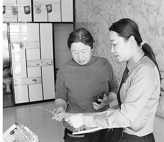
检察干警到居民家中普法宣传。