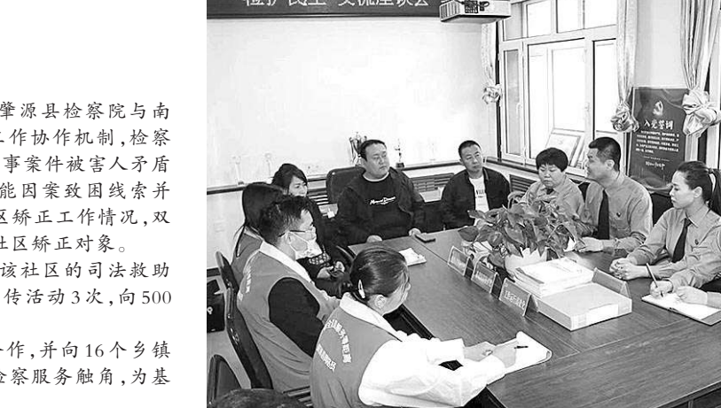
检察干警进社区调查因案致困人员情况。

不久前,黑龙江肇源县检察院与南苑社区建立社会治理工作协作机制,检察机关定期向社区通报刑事案件被害人矛盾化解情况,筛查可能因案致困线索并进行救助。同时,社区及时向检察机关反馈社区矫正工作状况,双方共同救助认罪悔过、服从管理及生活困难的社区矫正对象。