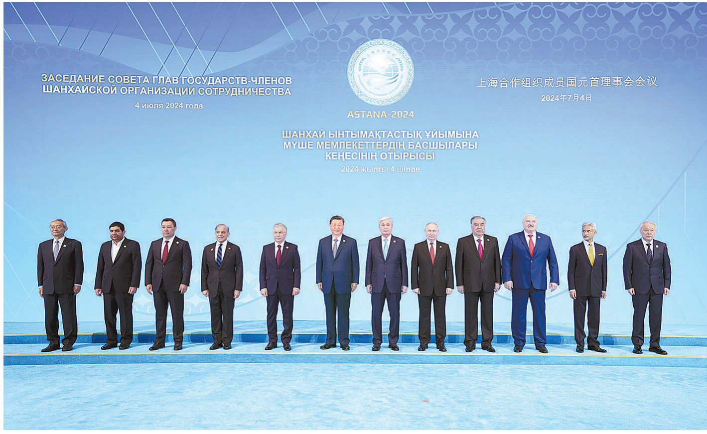
当地时间7月4日上午,国家主席习近平在阿斯塔纳独立宫出席上海合作组织成员国元首理事会第二十四次会议。