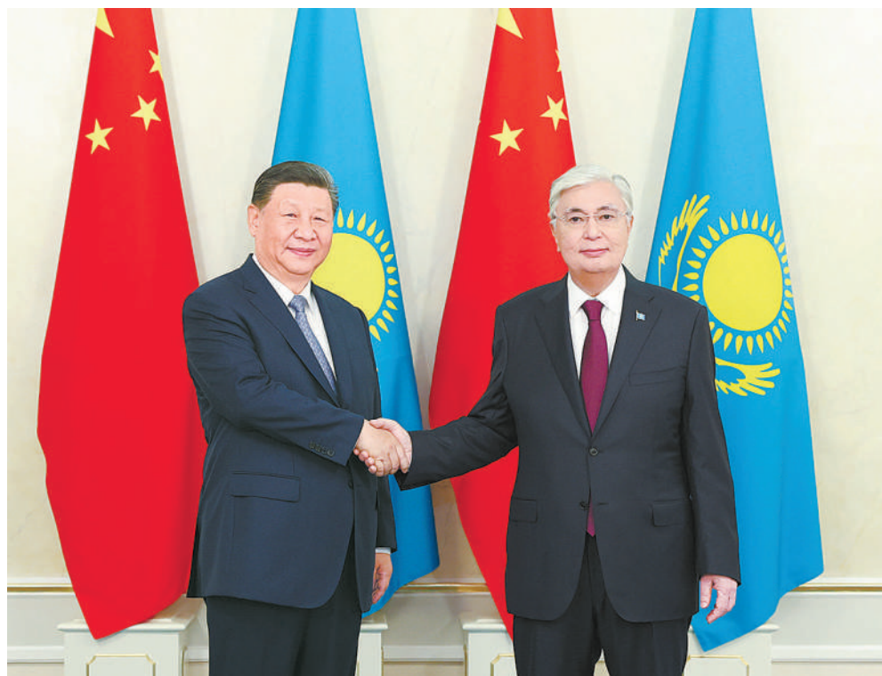
当地时间7月3日上午，国家主席习近平在阿斯塔纳总统府同哈萨克斯坦总统托卡耶夫举行会谈。这是习近平同托卡耶夫握手。

新华社阿斯塔纳7月3日电(记者倪义、胡晓光、张继业)当地时间7月3日上午，国家主席习近平在阿斯塔纳总统府同哈萨克斯坦总统托卡耶夫举行会谈。