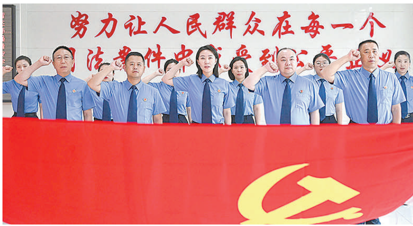
“七一”前夕，依兰县检察院举行重温入党誓词活动。