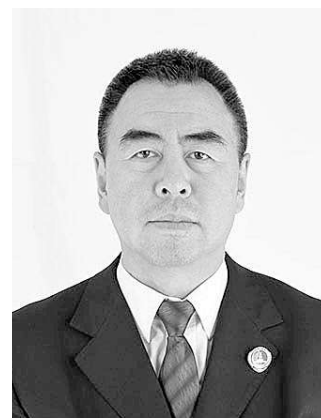
【关键词】耕地受损 土地管理 多元履职

“检察机关严厉打击违法违规占用耕地行为,在黑土地上守住了耕地红线。我看受损耕地已得到及时复垦,玉米苗长势喜人。”近日,吉林省长春净月高新技术产业开发区(下称“净月开发区”)人大代表肯定了该院办理的一起受损耕地公益诉讼案件的成效。