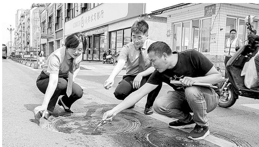
近日,四川省成都市新都区检察院检察官就群众投诉反馈的井盖沉降问题,推动该区综合行政执法局工作人员实地查看、调研,并研究处置方案。图为检察官在现场排查公益诉讼线索。

本报讯(记者周洪国 通讯员孙颖 刘璇) 近日,广东省深圳市光明区检察院联合该区妇联制定《关于建立妇女权益保障工作协作配合机制的意见》(下称《意见》)。《意见》围绕工作目标、工作机制、工作要求三个方面,确定了对口联系、信息通报、线索移送、办案协作、宣传联动、联合培训六项协作内容,要求两部门建立线索移送机制,检察机关加强与内部法律监督线索移送工作,区妇联及时向检察机关移送侵害妇女权益致使社会公共利益受损或者侵害妇女民事、行政合法权益等案件的线索,共同提升妇女权益保障工作质效。