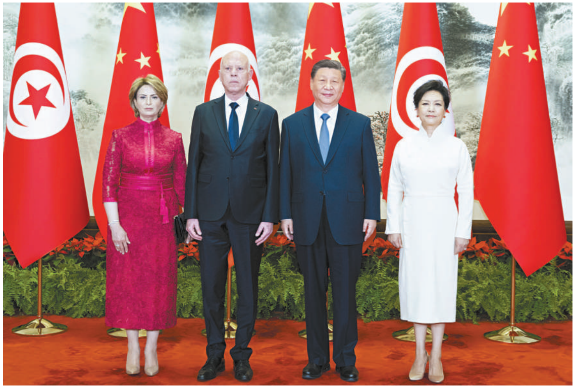
五月三十一日上午，国家主席习近平在北京人民大会堂同来华国事访问并出席中国—阿拉伯国家合作论坛第十届部长级会议开幕式的突尼斯总统赛义德举行会谈。这是会谈前，习近平和夫人彭丽媛同赛义德和夫人伊什拉克合影。

新华社北京5月31日电(记者郑明达 王宾) 5月31日上午，国家主席习近平在北京人民大会堂同来华国事访问并出席中国—阿拉伯国家合作论坛第十届部长级会议开幕式的突尼斯总统赛义德举行会谈。两国元首宣布，建立中突战略伙伴关系。 习近平指出，中国和突尼斯是好朋友、好兄弟。建交60年来，无论国际风云如何变幻，中突双方始终相互尊重、平等相待，彼此支持，谱写了发展中国家风雨同舟、守望相助的生动篇章。巩固好、发展好中突关系，符合两国人民的根本利益和共同期待。中方愿同突方一道，赓续传统友谊，深化各领域交流合作，推动中突关系迈上新台阶。今天我们宣布建立中突战略伙伴关系，必将开辟两国关系更加美好的未来。 习近平强调，中方支持突尼斯走符合自身国情的发展道路，支持突方独立自主推进改革进程，将命运牢牢掌握在自己手中。中方愿同突方加强发展战略对接，深化基础设施建设、新能源等领域合作，培育医疗卫生、绿色发展、水资源、农业等领域合作新动能，推动两国高质量共建“一带一路”取得更多成果，欢迎更多突尼斯优质特色产品进入中国市场。(下转第三版)