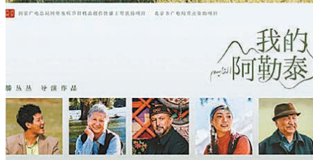
电视剧《我的阿勒泰》海报

义”更强调一种常识性的“理”,是人与人之间不可或缺规范保障;“礼性”则有着民族宗教文化的背景,它不算是一个书面语,更多来自口语,意指人特别明事理、守规则,能够让人明理守规,是源自“神性的力量”,不能不遵从。