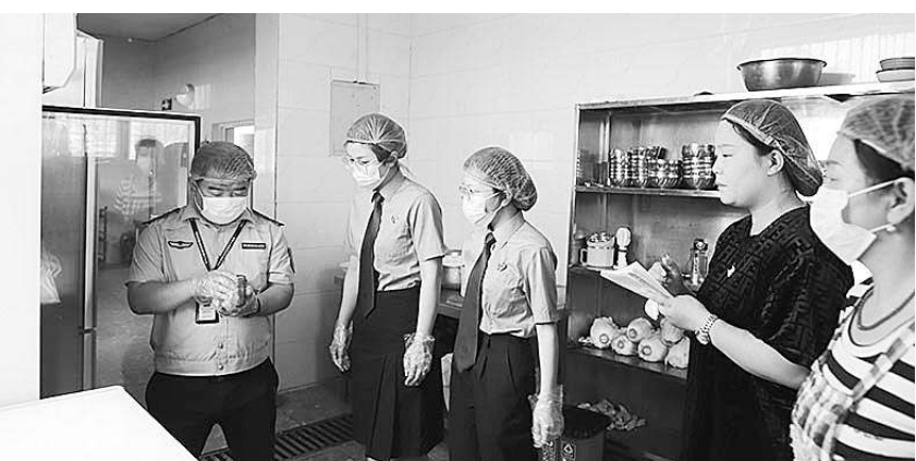
夏季来临，细菌病菌容易滋生蔓延，为切实守护人民群众“舌尖上的安全”，5月21日，河南省鹤壁市鹤山区检察院受邀对鹤壁市市场监督管理局鹤山分局开展的“夏季食品安全专项检查”执法活动进行全程监督。

本报讯(记者南茂林 通讯员景蕾) 近日，甘肃省平凉市检察院联合市仲裁委员会制定出台《关于加强仲裁与检察监督工作衔接的实施意见》(下称《实施意见》)，将虚假仲裁作为检察监督与仲裁工作衔接的重点，涵盖线索移送、会商研判、协助取证、仲裁员信息通告、联席会议、日常联络等机制。根据《实施意见》规定，双方将通过案件研判会商、联席会议、常态化联系联络等机制强化检察机关与仲裁机构的工作沟通，及时互通工作动态和反馈意见，加强检察监督和仲裁工作的衔接与协调，延伸检察监督职能，形成防范和惩治虚假仲裁等违法行为的合力。