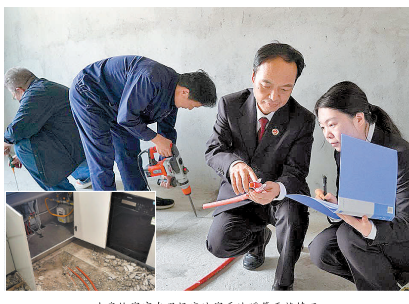
办案检察官在现场实地察看地暖管更换情况。

因涉及300余户业主的切身利益,公安机关邀请南京铁检院依法介入引导侦查。“对于业主而言,房子精装修交付时,更容易关注厨卫、地板等明装的精装项目,地暖管埋在地板下方,很难发现其质量、品牌等问题,如果业主入住后,在地暖管使用过程中出现堵塞、爆裂等情况,造成的财产损失往往会比较惨重。”了解案件基本情况后,承办检察官立刻决定第一时间鉴定产品质量是否符合合格。