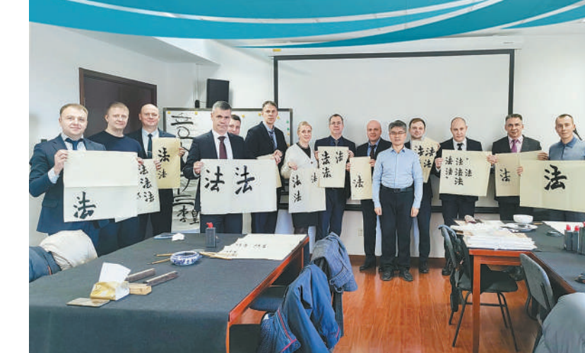
图①：2024年3月，最高人民法院“一带一路”检察研究基地和陕西省检察院、西安市检察院“一带一路”检察服务中心迎来首场外事交流活动。图为哈萨克斯坦国立大学校长图伊梅巴耶夫、占塞伊特在“一基地两中心”参观。