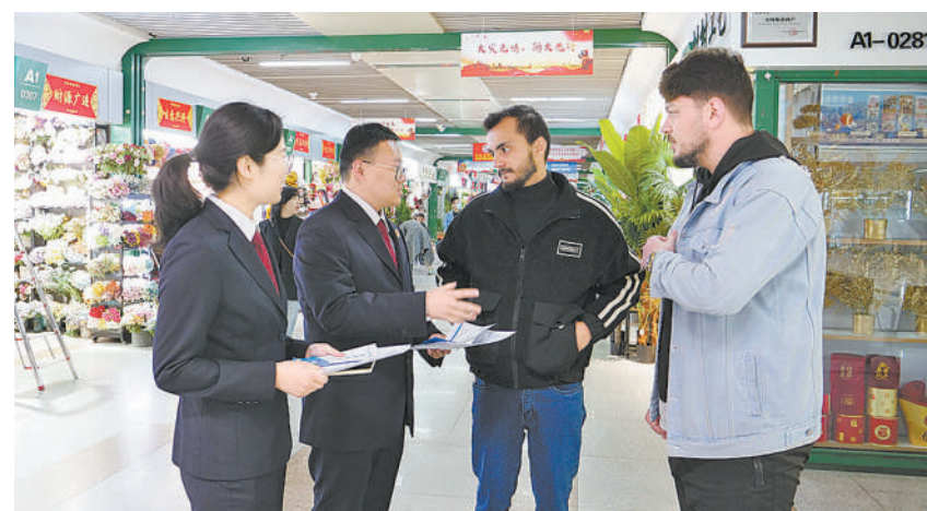
浙江省义乌市检察院检察官向外籍客商普及中国知识产权相关法律知识。

为确保外籍犯罪嫌疑人的权益得到充分保障，2014年，义乌市检察院联合多部门共建了诉讼翻译人才库，围绕保障外籍犯罪嫌疑人刑事诉讼权利问