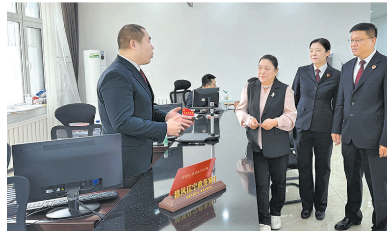
3月27日,全国人大代表庄艳(右三)在辽宁省鞍山市检察院听取该院副检察长钟鸣介绍检察工作情况。

全国人大代表庄艳担任检察公益诉讼形象大使 形成全社会共同参与公益诉讼宣传良好氛围