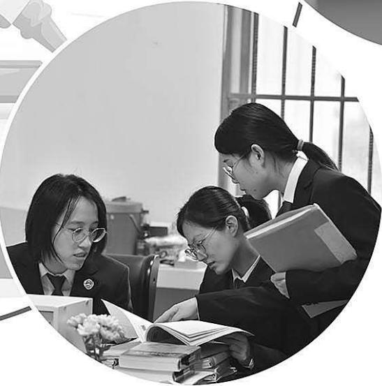
▲安徽省合肥高新技术产业开发区检察院检察官在讨论案情。