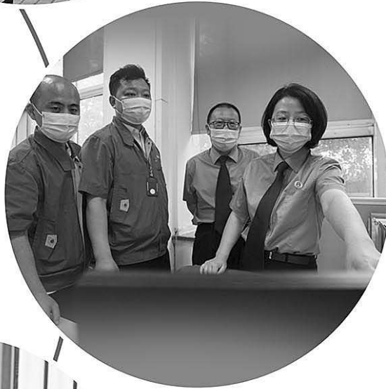
▲辽宁省沈阳高新技术产业开发区检察院检察官到被侵权企业调查取证。