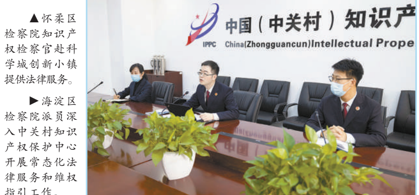
▲怀柔区检察院知识产权检察官赴科学城创新小镇提供法律服务。