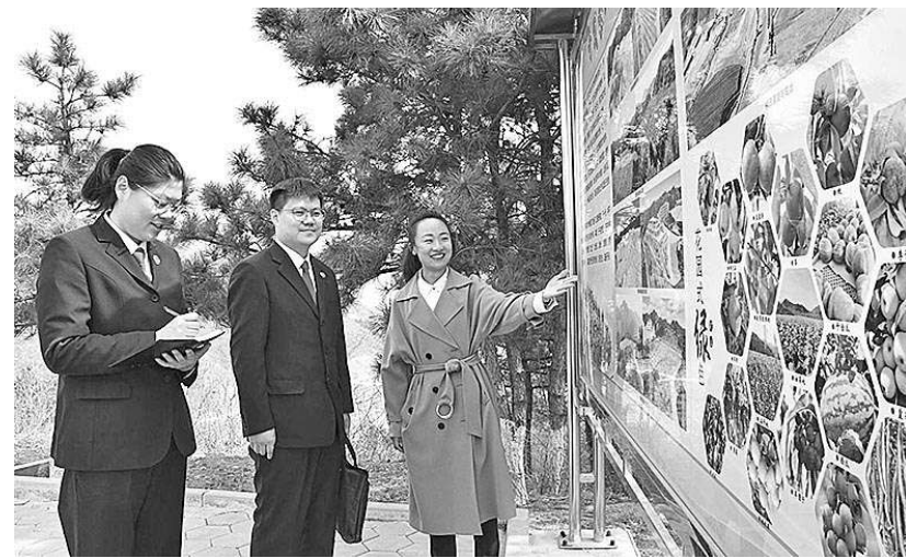
近日, 河北省宽城满族自治县检察院检察官到辖区企业走访, 与企业负责人面对面交谈, 深入了解企业法治需求。

本报讯(记者刘呈军 通讯员徐素娟) 近日, 云南省昆明市五华区检察院联合区法院、司法局举行“行政争议化解工作室”揭牌仪式, 进一步健全行政争议多元化预防化解调处综合机制, 提升行政争议实质性化解成效。据悉, 工作室的成立是区检察院与区法院、司法局通过整合多方优势, 发挥多元解纷合力, 提供纠纷化解“一站式”服务, 常态化统筹推进行政争议协调调处, 将联合解纷的触角延伸到基层治理的“神经末梢”, 努力满足人民群众日益增长的多元化司法需求。