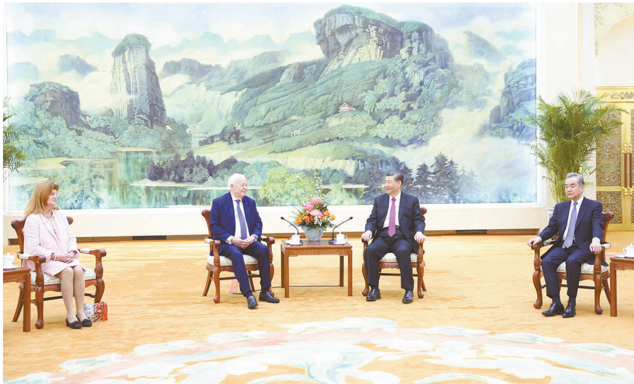
4月8日，国家主席习近平在北京人民大会堂会见法国梅里埃基金会主席梅里埃夫妇。