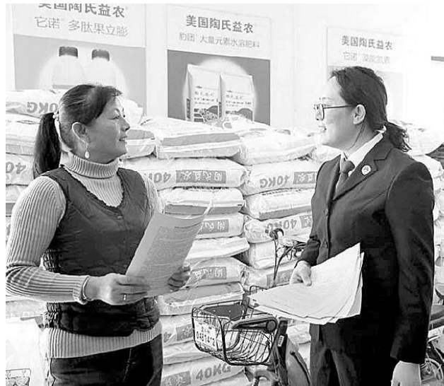
检察官向农资商户宣传农资领域法律知识。