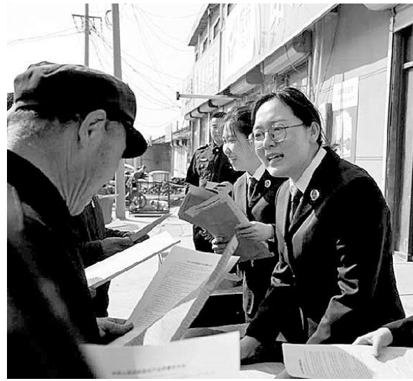
检察官街头普法引导群众自觉抵制假冒农资产品。