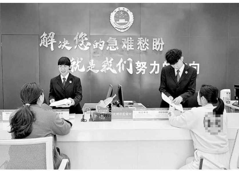
成都市双流区检察院干警耐心解答信访群众问题。