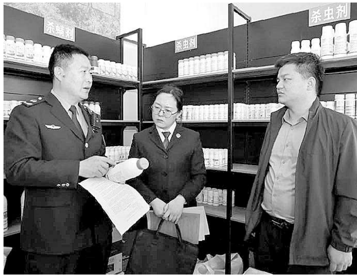
检察官向市场监管部门执法人员了解农资市场监管情况。