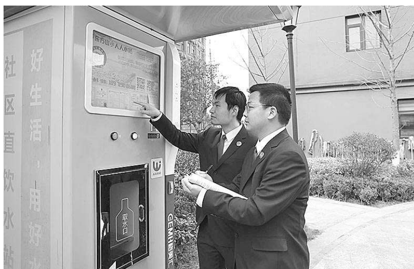
3月12日,湖北省十堰市郧阳区检察院检察官对辖区直饮水设备整改情况进行“回头看”。据了解,该院此前针对直饮水抽样调查发现的问题制发检察建议,督促相关部门及时进行整改。

本报讯(记者单曦)近日,宁夏回族自治区检察院联合自治区妇联举办“关注困难妇女群体 加强专项司法救助”活动联席会议。会议强调,全区检察机关要聚焦妇女平等就业、人格权以及残疾妇女、老龄妇女等弱势困难妇女群体的权益保障,持续深入推进弱势困难妇女群体专项司法救助工作,不断强化精准救助、有效救助,努力在检察环节做到应救助尽救助;持续推进检察机关内部协调配合,着力巩固办案部门向控申部门移送司法救助案件线索机制成效;进一步探索利用大数据建模发掘救助线索,不断拓宽救助案源,提升救助效果。