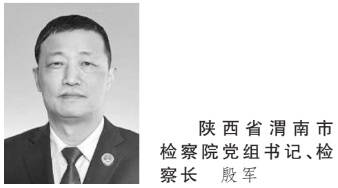
陕西省渭南市检察院党组书记、检察长 高峻

一体推进检察机关政治建、业务建设和职业道德建设(以下简称“三个建设”),打造一支信得过、靠得住、能放心的高素质过硬检察队伍,是实现检察工作现代化、服务保障中国式现代化的重要基础和根本保障。