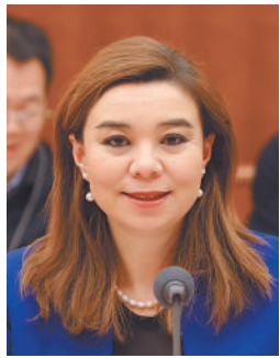
再依努热·塔里哈提代表