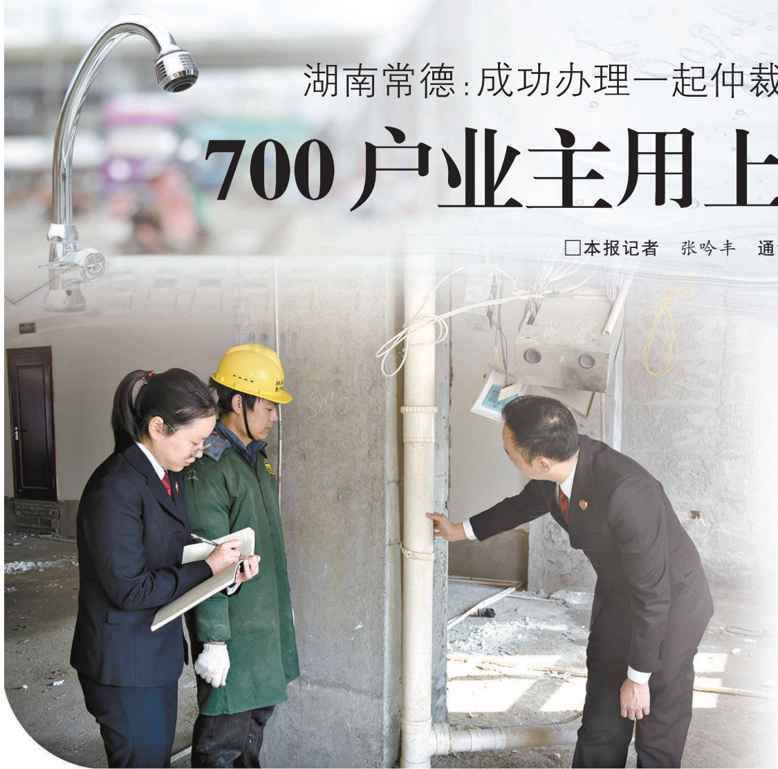
办案组前往案涉小区开展实地调查。

“‘一户一表’改造后，自来水公司提供24小时的全天候服务，业主再也不用为管道维修烦恼，也不用担心分摊高额水损和额外水费，总算能明明白白缴费，安安心心用水了。”近日，湖南省常德市检察院检察官在对一起仲裁裁决执行监督系列案跟踪回访时，汉寿县蓝天小区业主委员会的代表高兴地说。