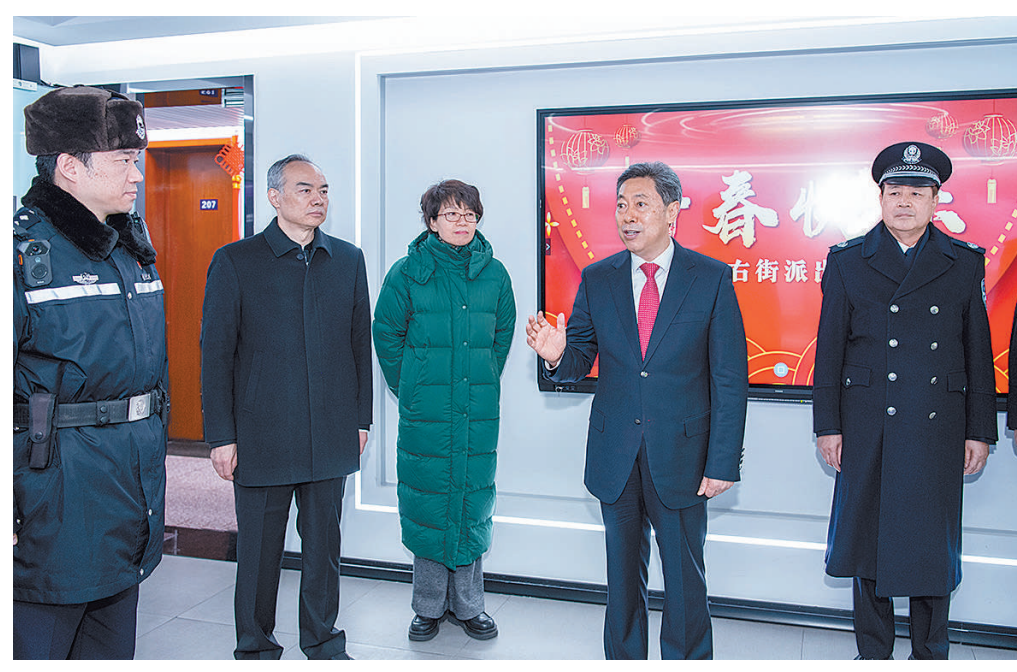
2月8日,中共中央政治局委员、中央政法委书记陈文清在北京调研并看望慰问基层政法干警。

陈文清指出,当前,维护安全稳定任务艰巨繁重,政法机关要增强忧患意识,坚持底线思维,极限思维,严格落实维护社会稳定责任制,压实各方责任,周密落实各项节日安保措施,把“时时放心不下”的责任感转化为“事事心中有底”的行动力,