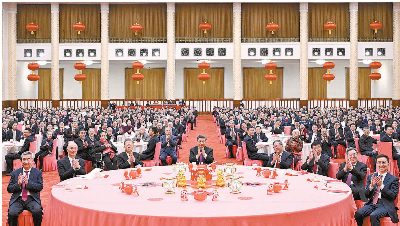
2月8日,中共中央、国务院在北京人民大会堂举行2024年春节团拜会。中共中央总书记、国家主席、中央军委主席习近平发表讲话。